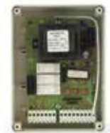
Q45 Control board 230V for rolling shutter Centrale di comando 230V per serranda