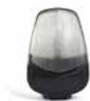
Luce LED blinker Lampeggiatore LED