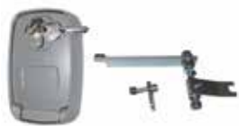
RT23 Brackets set for CENTRAL fixing Cassaforse con pulsante e leva per lo sblocco dall'esterno