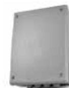
Q80A/Q20A Centrale di gestione con ricevitore 433,92 MHz

Control board integrated with plug-in radio receiver 433.92 MHz