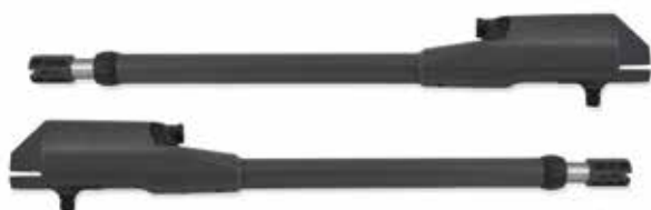
ACE TI Coppia attuatori lineari telescopici con staffe di fissaggio