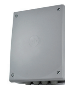
Q80A/Q20A Centrale di gestione con ricevitore 433,92 MHz

Control board integrated with plug-in radio receiver 433.92 MHz