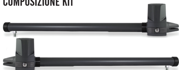
LEADER TA Coppia attuatori a tubo protetto con staffe di fissaggio