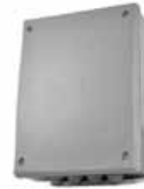
Control board Centrale di gestione